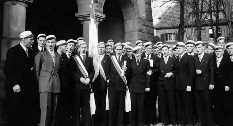
Die aus Paulinern und Schilleranern bestehende Abiturientia 1951 nach bestandem Abitur vor dem Schulgebäude des Schiller-Gymnasiums.