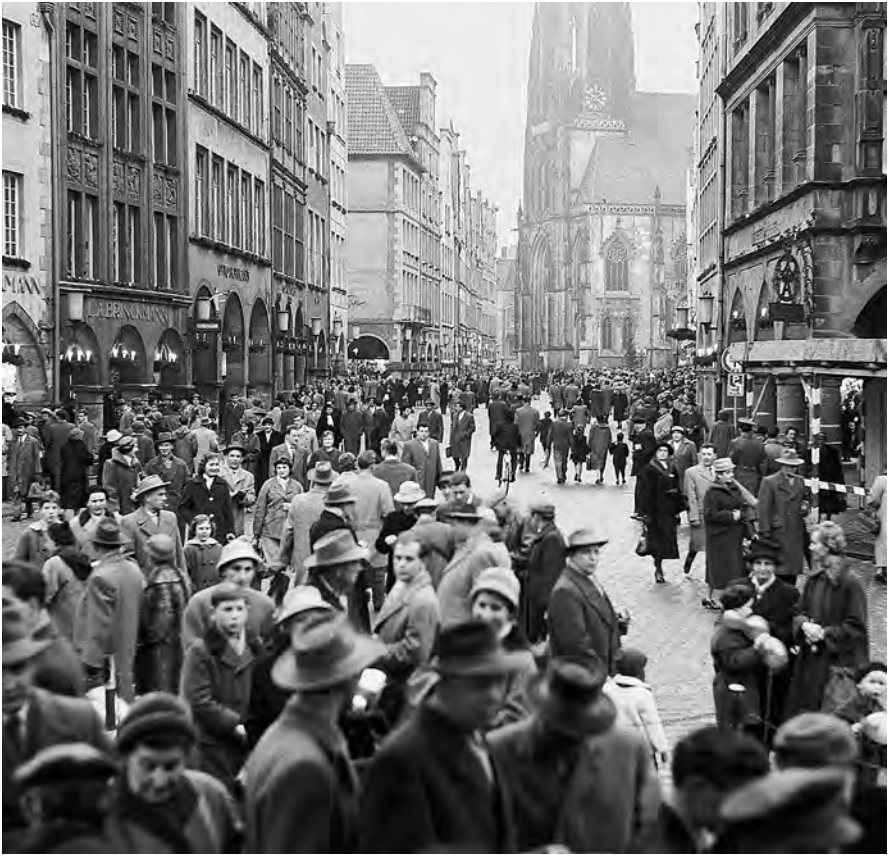
MÜNSTER'S GUTE STUBE: Wer vor 50 oder 60 Jahren das Abitur gemacht hat, der hat den Prinzipalmarkt so wie auf diesem Bild in Erinnerung. Auch in den 1950er Jahren brummte in Münster das Weihnachtsgeschäft. Allerdings blieb vielen Arbeitnehmern bei einer Sechs-Tage-Woche kaum Zeit zum Einkaufsbummel. Daher hatten die Geschäfte in Münsters Innenstadt wie in allen deutschen Städten an den drei Sonntagen vor dem Fest geöffnet. Im Volksmund waren das der kupferne, der silberne und – wie auf diesem Foto vom 20. Dezember 1958 – der goldene Sonntag. Weitere Fotos zum Prinzipalmarkt zwischen Kaiserreich und Wiederaufbau zeigt die Stadtmuseumsausstellung „Der Prinzipalmarkt in Münster“ bis zum 8. Mai 2011.

1; Journalistik 1; Ingenieur 2; Verwaltungsdienst 1.