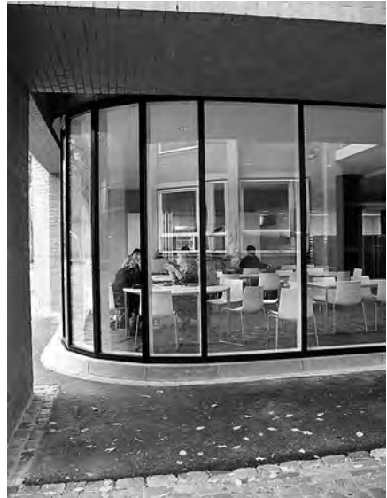
Gastlich und gemütlich wirkt die neue Mensa des Paulinums.